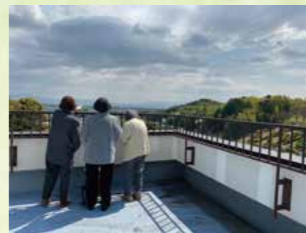
屋上で体操をしたり