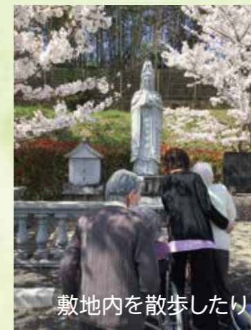
敷地内を散歩したり